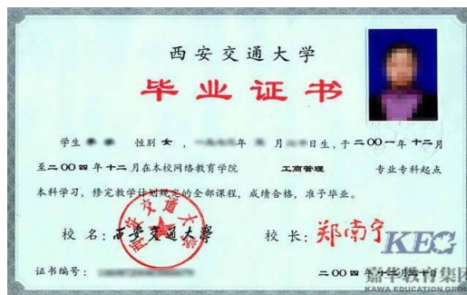
教育部学历证书电子注册备案表

(九)泰安户籍的往届毕业生须提供(1)学位学历证书照片；(2)《教育部学历证书电子注册备案表》或《中国高等教育学历认证报告》，确保学籍或学历报告上的二维码在网上确认期间有效；(3)户口本首页、索引页及个人单页(集体户口仅提供首页及个人单页)。