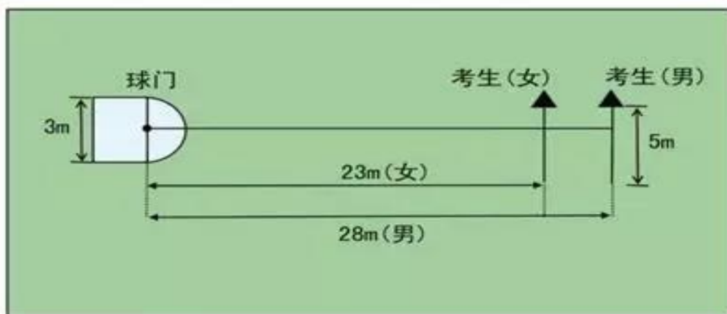
图 2-1 传准场地示意图

① 考试方法 ：如图 2-1 所示，传球目标区域由一个室内五人制足球门（球门净宽度 3 米，净高度 2 米）和以球门线为直径（3 米）画的半圆组成，圆心（球门线中心点）至起点线垂直距离为男子 28 米，女子 23 米。考生须将球置于起点线上或线后（线长 5 米，宽 0.1 米），向目标区域连续传球 5 次，左右脚均可，脚法不限。