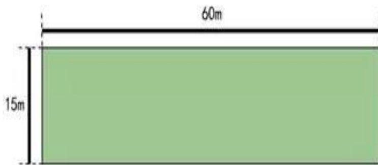
图 2-3 掷远与踢远场地示意图

① 考试方法： 如图 2-3 所示，在球场适当位置画一条 15 米线段作为测试区横宽，从横线两端分别向场内垂直画两条 60 米以上平行直线作为测试区纵长，标出距离数。考生站在起点线后，先将球以手掷远 3 次（允许带手套进行），然后用脚踢远 3 次（采用踢凌空球、反弹球、定位球等方法不限），各取其中最好一次成绩相加为最终成绩。每次掷、踢球的落点必须在测试区横宽以内，否则不计成绩。