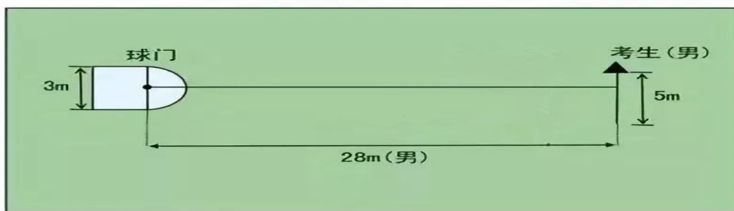
定位球传准示意图

②评分标准：以球从起点线踢出后，从空中落到地面的第一接触点为准。考生每将球传入目标区域的半圆内（含第一落点落在圆周线上），或五人制球门（含球击中球门横梁或立柱弹出）即得4分。每人须完成5次传准，满分20分。